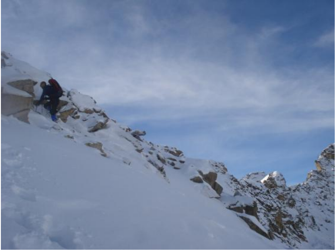
LLEGANDO A LA CUMBRE..