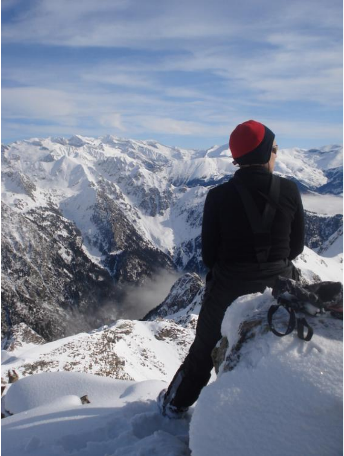
FOTO CUMBRE. AL FONDO EL MACIZO DEL MALADETA.