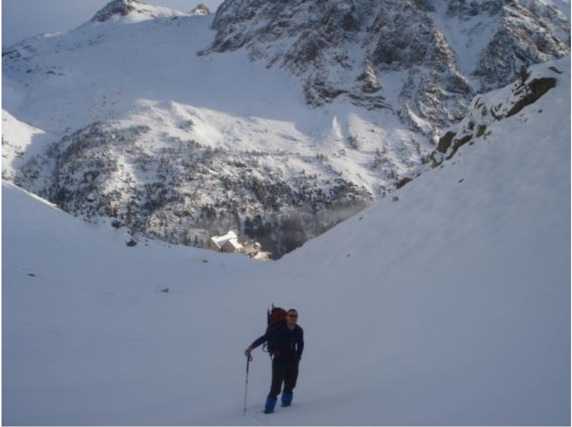
INICIO DE LA ASCENSIÓN EL REFUGIO AL FONDO.